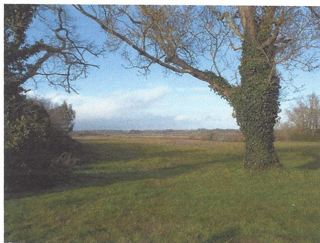
Le Tour du Parc

Cependant, au même endroit, deux autres hectares en zone Natura 2000 seront artificialisés intégralement pour une salle polyvalente, résidence seniors, zone de loisirs et aire de stationnement. L'affaire est devant le tribunal administratif.