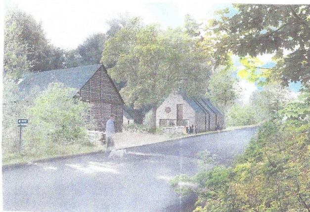
Toulindac future école de voile

Une concertation a été engagée entre Vannes Agglo et les Amis des chemins de ronde pour permettre à Toulindac en Baden la réalisation d'une petite base nautique en Espace remarquable. Puissent ce projet aller à son terme et les enfants de Vannes agglo apprendre la voile dans un environnement riche d'une biodiversité sauvegardée.