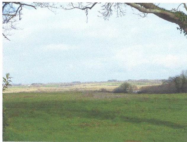
Le Tour du Parc une fenêtre sur le marais va disparaître

Un lotissement de 27 lots minimum a été contesté à Belz à l'aplomb de la ria du Sac'h, classée Natura 2000 et Espace remarquable. L'association dénonce le manque de continuité avec une urbanisation conséquente. La commune prétend que la ria crée une continuité entre les maisons sur les rives de Belz et d'Etel.